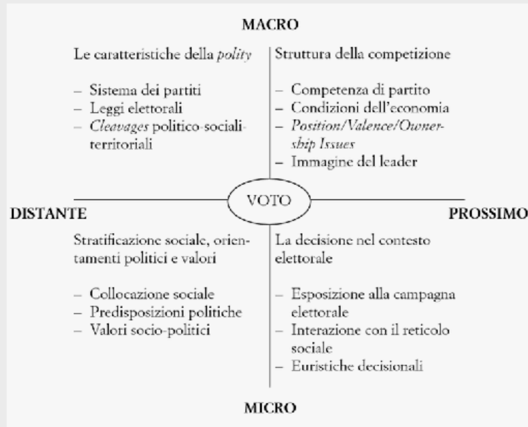
FIG. 1.1. La costellazione di alcune variabili esplicative del voto secondo lo schema bidimensionale di Rokkan.

cognitivo di scelta dell'elettore. La figura 1.1 colloca le variabili rilevanti esaminate secondo il loro ordinamento nei quadranti della tipologia di Rokkan.